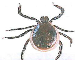
Mascul - Adult