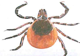
Femelă - Adultă